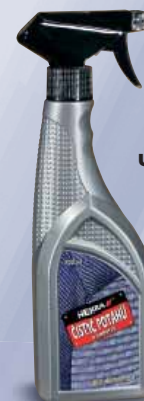
SEAT COVERS CLEANER REINIGUNGSMITTEL FÜR BEZÜGE ЧИСТЯЩЕЕ СРЕДСТВО ДЛЯ ОБИВКИ