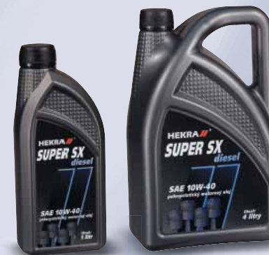
HEKRA M7ADX super stabil SAE 15W-40 API SF/CC

RUS круглогодичное моторное масло предназначенное к смазке современных бензиновых и дизельных двигателей легковых и легкогрузовых автомобилей