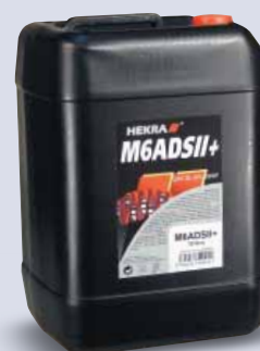
HEKRA M6ADSII+ SAE 30 API CD/SF

RUS одноэтапное моторное масло предназначенное к смазке старых типов бензиновых и дизельных двигателей с невысокими требованиями к техническим качествам масла: используется при летней эксплуатации