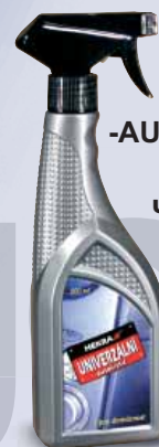
UNIVERSAL CARCLEANER UNIVERSAL -AUTOREINIGUNGSMITTEL УНИВЕРСАЛЬНОЕ ЧИСТЯЩЕЕ СРЕДСТВО