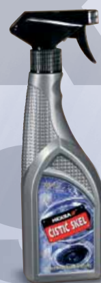
ČISTIČ SKEL GLASSES CLEANER GLASREINIGUNGSMITTEL ОЧИСТИТЕЛЬ СТЕКОЛ