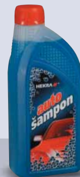
AUTOŠAMPON AUTOSHAMPOO AUTOSCHAMPON АВТОШАМПУНЬ