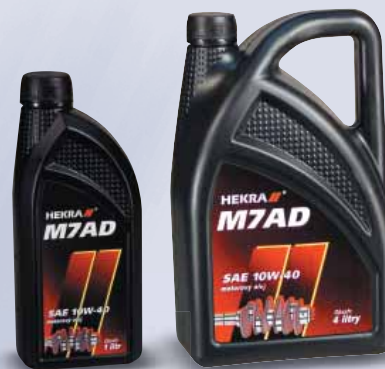
HEKRA M7AD SAE 10W-40 API SD/CC

RUS круглогодичное моторное масло предназначенное к смазке старых типов бензиновых и дизельных двигателей, с невысокими требованиями к техническим качествам масла