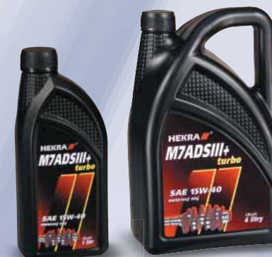
HEKRA M7ADSIII + turbo SAE 15W-40 API CF-4/SJ

RUS круглогодичное моторное масло предназначенное для турбодизельных двигателей с высокой тепловой нагрузкой: используется и для четырехцилиндровых бензиновых и дизельных двигателей легковых автомобилей, работающих в максимальных нагрузках; обеспечивает высокую защиту от износа двигателя, а в зимний период хорошие стартовые условия